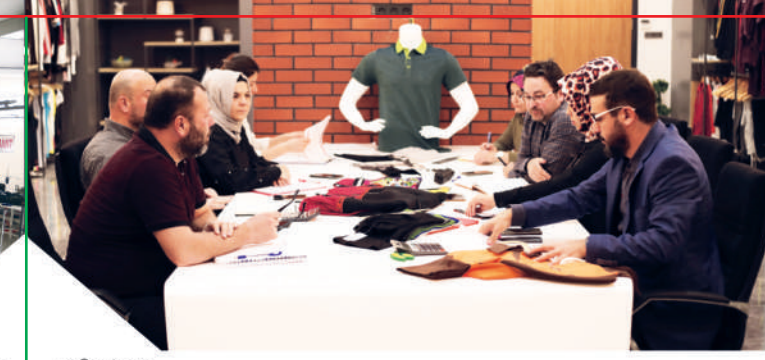
» Our team

www.aysoytextile.com.tr info@aysoytextile.com.tr